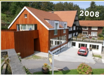
Haus mit Neubau