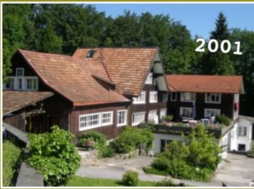
Haus mit Stall